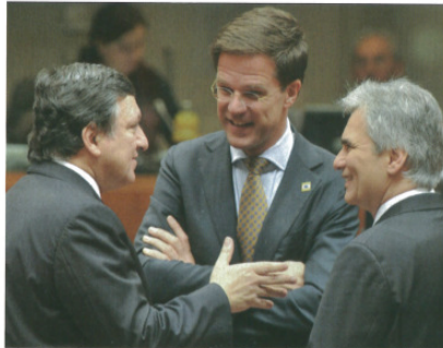
EU-Kommissionspräsident Jose Manuel Barroso (re.) mit dem niederländischen Premier Mark Rutte (li.) und Bundeskanzler Faymann.

Für eine neue Form der Vertragsvergabe spricht wohl auch die zunehmende Internationalisierung der Politik. Ein Großteil der politischen Entscheidungen wird heute auf europäischer Ebene getroffen. Auch wenn das die heimische Politik gerne anders darstellt, die Weichen