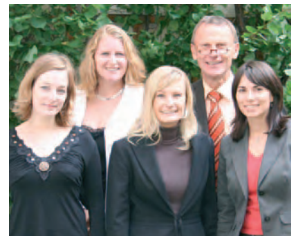
HILL International Salzburg