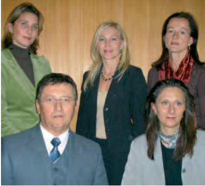
HILL International Linz