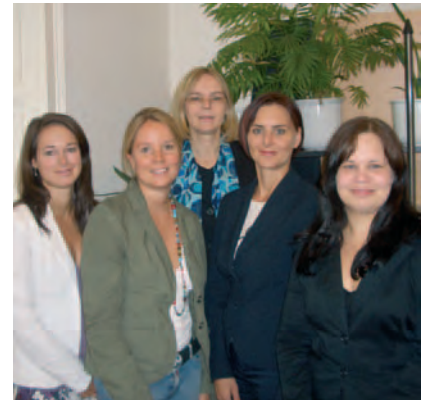
HILL WOLTRON Management Partner Graz

ner geleitet. Das Grazer Team berät steirische Unternehmen und öffentliche Institutionen in sämtlichen Angelegenheiten der Personalsu-