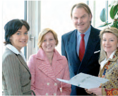
HILL International Klagenfurt